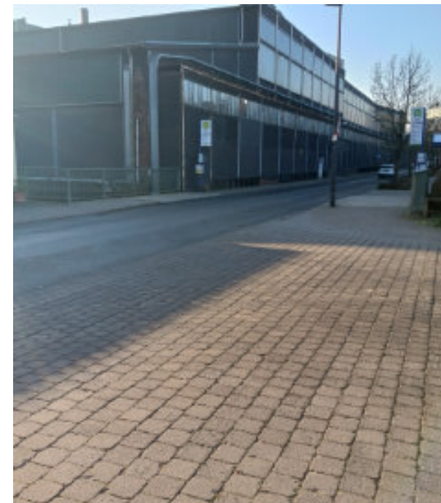
Bushaltestelle Scheidertalstraße/Untig Mühl

Fraktionen einstimmig gefolgt. Leider ist bis heute keine Umsetzung erfolgt. Dies ist der Auftrag: Der Gemeindevorstand erhält den Auftrag zeitnah Möglichkeiten zu eruieren, um die Verkehrs- und Sicherheitssituation der Busfahrgäste und FußgängerInnen schnell und wirksam zu verbessern. Bus-