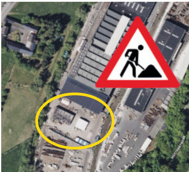
Gebiet der Kistenschreinerei

Sept. 2025 – 2015 entwickelte der damalige BGM eine Idee und man startete den Verkauf der Liegenschaft in der Kettenbacher Scheidertalstraße, der dann auch erfolgte. 2021 wurden Grundstück und Gebäude „Kistenschreinerei“ – hinter dem Rathaus gelegen – gekauft, nachdem eine andere priorisierte Variante gescheitert war. Vor dem Erwerb wurde das Ziel des Umbaus als machbar eingestuft – mit überschaubarem finanziellen Einsatz. Seitdem zieht sich das Vorhaben mit einigen Wirrungen und Irrungen bis heute hin und leider wurde viel Zeit und Geld verschwendet. Im Sep-